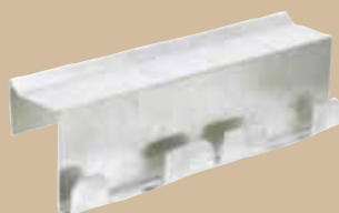
Hållare för upphängning av 21 och 29-liter på kârl. Art.nr 8095 835