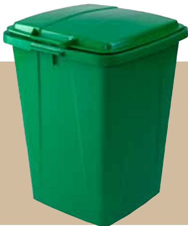
Behållare 90 liter för stora, lätta fraktioner. Art.nr 8122 830. Lock som tillbehör.