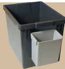
Behållare 21 liter. Med stansat uttag för 2-litersbox. Art.nr 8095 752 2-litersbox. Art.nr 8109 830