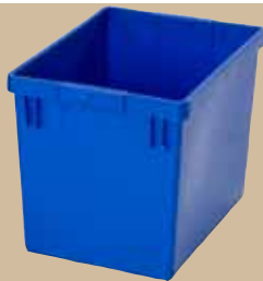
Behållare 21 liter. Art.nr 8095 000