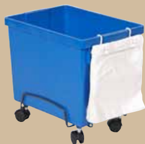
21-litersbehållare på vagn.