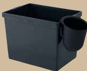
1-literskopp placerad som tillbehör på 21-litersbox. Art.nr 8120 830