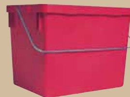
Grepe Till 21- och 29-liters- behållare. Art.nr 8096 000