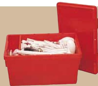
Behållare 42 liter. Art.nr 8093 000 Mellanvägg. Art.nr 8094 000 Lock. Art.nr 8093 820