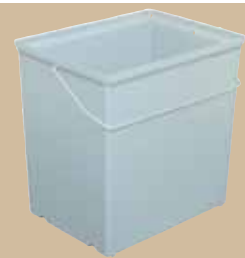
Hink 17 liter med grepe. Art.nr 6393 000