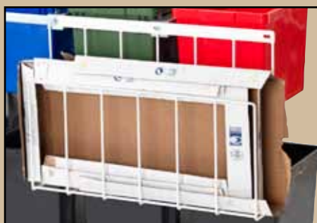
Wellpapphållare Art.nr 8130 832