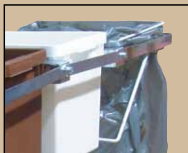
Säckhållare Art.nr 8130 839 Bottenplatta Art.nr 8130 840