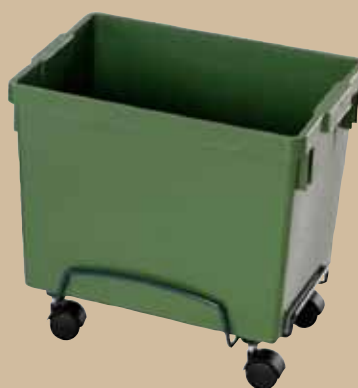
Ergovagn I svartlackerad metall. För 21- eller 29-literskärl. Art.nr 8133 835