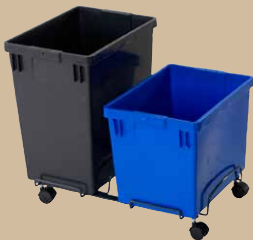
Ergovagn I svartlackerad metall. Med 21- och 29-literskärl. Art.nr 8133 836