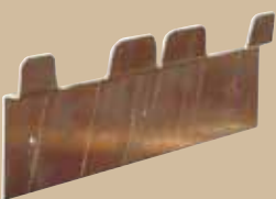
Upphängningsskena för 21 och 29-liter på vägg. Art.nr 8095 836