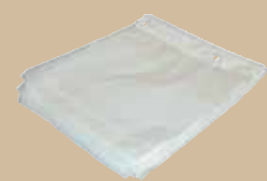
Plastpåsar A5 (21-liter) Art.nr 8095 900 Plastpåsar A4 (29-liter) Art.nr 8096 900