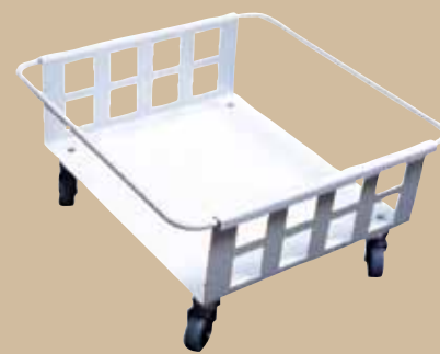
Metallvagn till 60- och 90-liters- behållare 60-liters Art.nr 8121 832 90-liters Art.nr 8122 832 2 x 60-liters Art.nr 8121 833