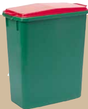
Behållare 60 liter. Art.nr 8121 830 Lock som tillbehör.