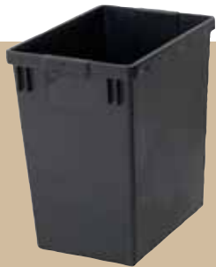
Behållare 29 liter. Art.nr 8096 000