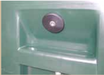
Transponder Material af AV-beständig polyamid og helt vandafvisende. Art.nr 844 163 Alternativ transponder kan leveres på forespørgsel.