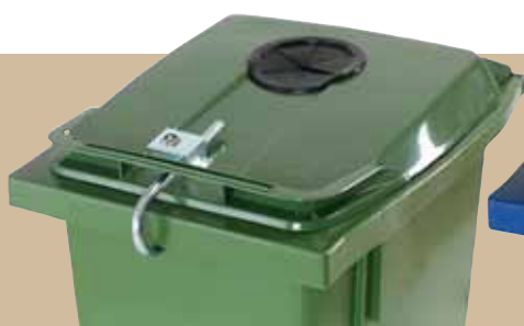
Glasingkast Låg med glasingkast inklusive lås. 190 liter. Art.nr 0190 802 370 liter. Art.nr 0370 802