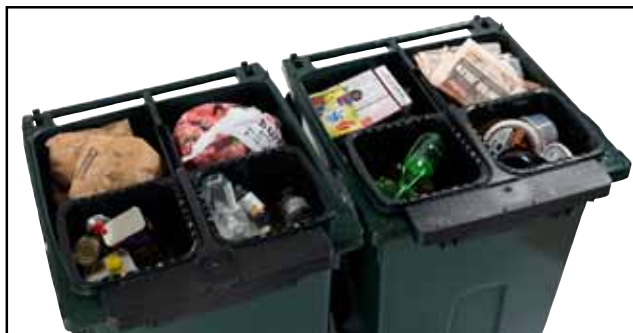
Let og sjovt at affaldssortere.

QuattroSelect er omkostningseffektivt for både kunde og bruger. Abbonnten motiveres til affaldssortering nær sin egen husholdning takket være QuattroSelects ottefraktionssystem. Der frigøres plads i hjemmet, da man slipper for at delsamle affald i forskellige beholdere. I stedet placerer man affaldet i dertil indrettede beholderrum. Yderligere en besparelse, for abonnenten, er at slippe for at samle øvrigt affald sammen og køre til genbrugsstationen.