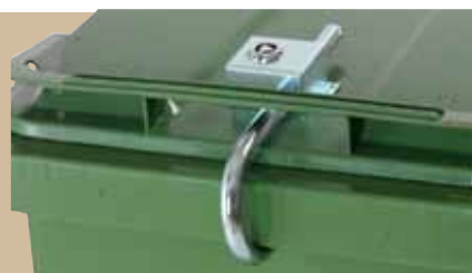
Bøjlelås Låset nittes fast. Åbning og lukning sker med trekantsnøgle. Art.nr 844 015