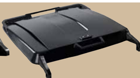
Ergolag 370 liter. Art.nr 0370 805 ErgoPlus. Art.nr 0370 805