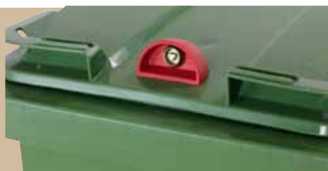
Gravitationslås Gravitationslåset låser op af sig selv når beholderen når en bestemt vinkel i tømningscyklus. Beholderen låser sig når det stilles tilbage på jorden. Nøgler behøves ikke for tømningspersonalet, nøglen opbevares af kunden. Art.nr 844 140