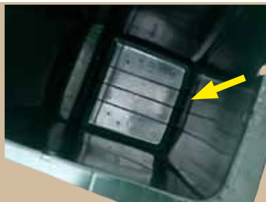
Styreribber Visse modeller af PWS-beholdere kan leveres med støbte styreribber for enkel montering af skillevægge. Angives ved bestilling