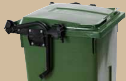
Ergohandles Nedfædet stilling, sparer plads i f. eks. affaldsskur.