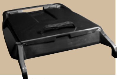
Ergolag 190 liter. Art.nr 0190 803