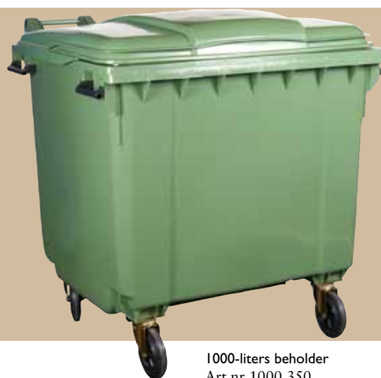
1000-liters beholder Art.nr 1000 350 Låg art.nr 1000 381