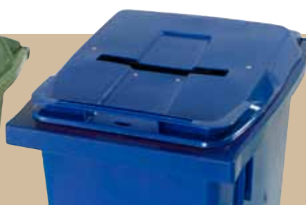
Låg med papirindkaståbning Låsbart til fortroligt papir. 190 liter (låg). Art.nr 0190 804 190 liter (beholder). Art.nr 0190 610