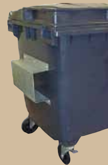
Frontlastertunneler For hentning med truck. Art.nr 844 659