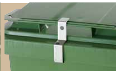
Låsbøjle Ingen boring af huller eller montering er nødvendig. Hængelås medfølger ikke. 80 - 120 liter Art.nr 844 601 140 liter Art.nr 844 602 190 - 370 liter Art.nr 844 601 660 - 770 liter Art.nr 844 602 Min bøjlelængde: 30 mm Max diameter: 7 mm