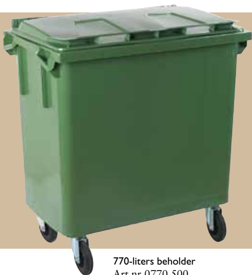
770-liters beholder Art.nr 0770 500 Låg art.nr 0770 801