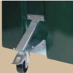
Fronthjul For beholdere 80 - 370 liter. Eftermontering nødvendig. Hjulet stikker ca 220 mm ud fra beholderen. Art.nr 0370 830