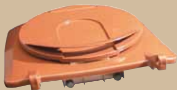
Ergolag 140 liter. Art.nr 0140 803