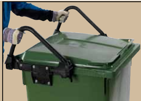
Ergohandles Ergonomisk for personale uanset kropsstørrelse. Art.nr 8023