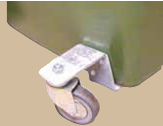
Fronthjul Fronthjul for 190 liter beholder. Eftermontering nødvendig. Art.nr 0190 830