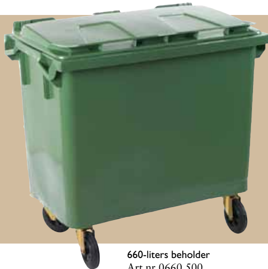
660-liters beholder Art.nr 0660 500 Låg art.nr 0660 801