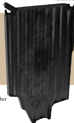
Skillevægge Skillevæg til 2- og 3-hjulsbeholdere 190 liter. Art.nr 8010 200 240 liter. Art.nr 0240 900 370 liter. Art.nr 8013 000 093 373'eren. Art.nr 8013 373 093