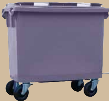
Togkoblingssæt Skrues fast ved beholderens eksisterende hjul. 660 liter. Art.nr 844 658, 1000 liter. Art.nr 844 652