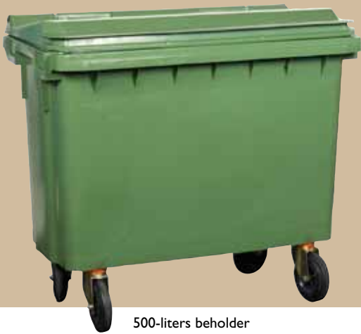
500-liters beholder Art.nr 0500 350 Låg art.nr 0500 380

Løftekammen er standard og passer til de almindeligt forekommende løftekamme på markedet. Beholderen kan tømmes af traditionelle renovationsbiler, både bag- og sidetømmere. Låg og beholdere kan mærkes med varmprägning og/eller indsatser i formen. Samtlige PWS beholdere er forberedte for montering af transpondere.