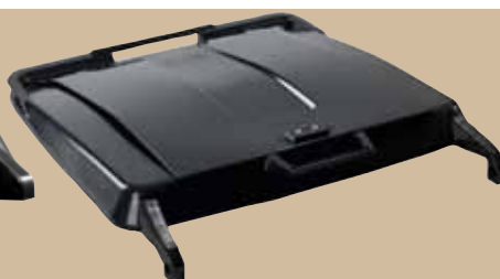
Ergolock 370 liter. Art.nr 0370 805 373:an. Art.nr 0370 805