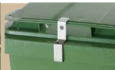
Låsbygel Ingen håltagning eller montering krävs. Hänglås medföljer ej. 80 - 120 liter Art.nr 844 601 140 liter Art.nr 844 602 190 - 370 liter Art.nr 844 601 660 - 770 liter Art.nr 844 602 Min bygellängd: 30 mm Max diameter: 7 mm