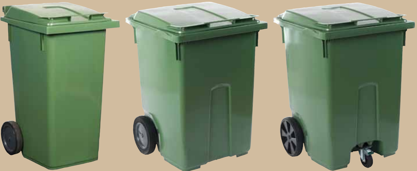
240-liters kärlell Art.nr 0240 601 Lock art.nr 0240 801