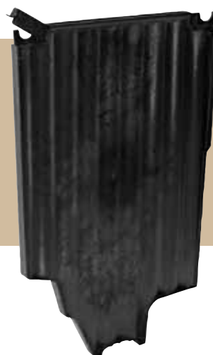
Avdelare Mellanvägg till 2- och 3-hjulskärl 190 liter. Art.nr 8010 200 240 liter. Art.nr 0240 900 370 liter. Art.nr 8013 000 093 373:an. Art.nr 8013 373 093