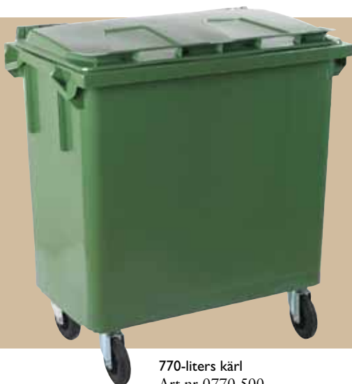
770-liters kärl Art.nr 0770 500 Lock art.nr 0770 801