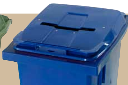
Lock med pappersöppning Låsbart sekretesslock för papper. 190 liter (lock). Art.nr 0190 804 190 liter (kärl). Art.nr 0190 610