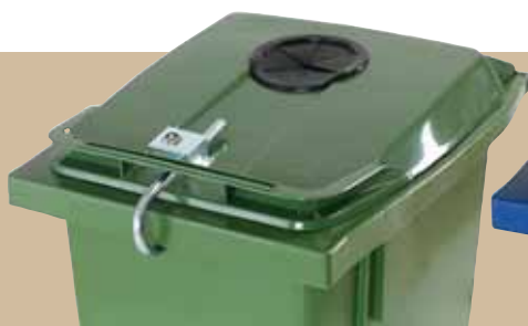
Glasinkast Lock med glasinkast inklusive lås. 190 liter. Art.nr 0190 802 370 liter. Art.nr 0370 802