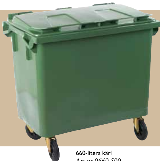
660-liters kärl Art.nr 0660 500 Lock art.nr 0660 801