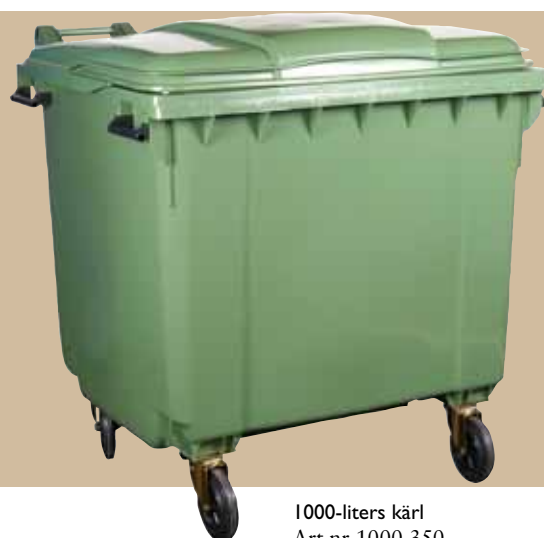
1000-liters kärl Art.nr 1000 350 Lock art.nr 1000 381