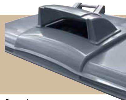
Pappersshuv Samtliga PWS kärl kan utrustas med pappersshuv.