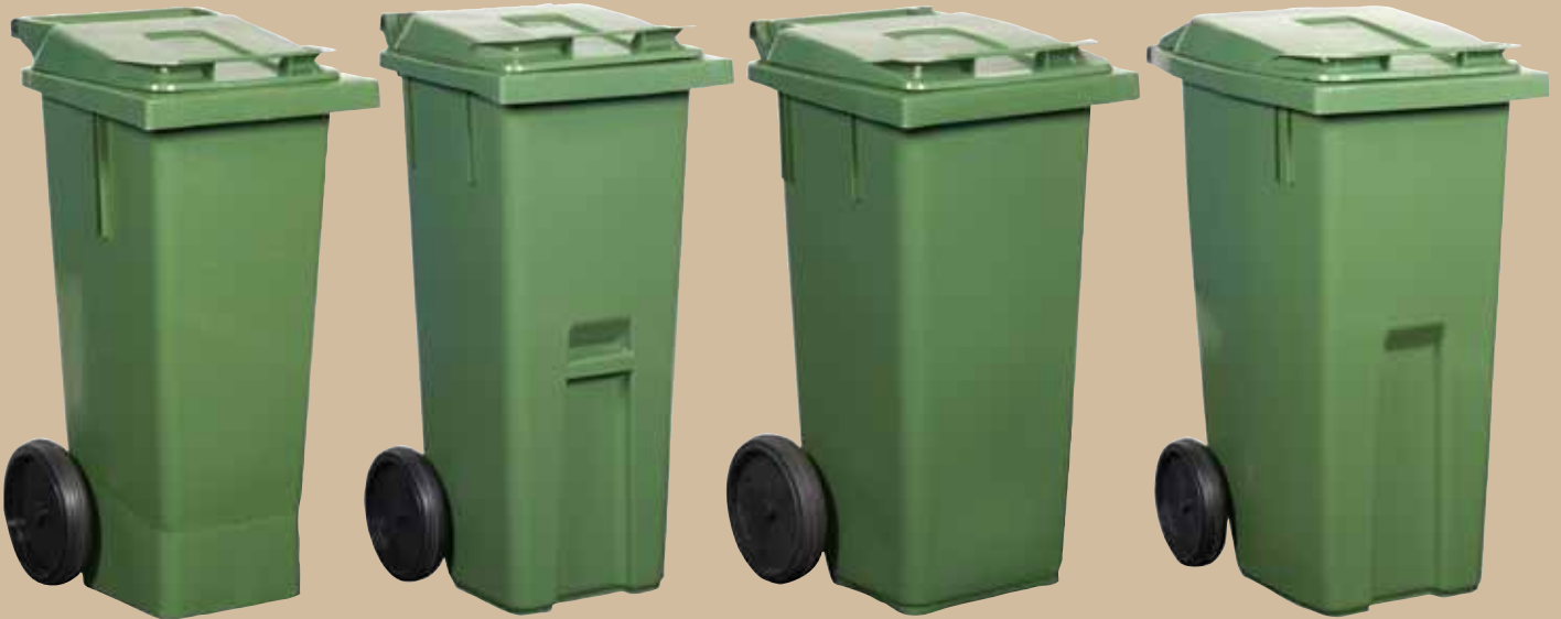
80-liters kärlell Art.nr 0080 601 Lock art.nr 0080 801

hjul. ErgoPlus är dessutom utrustat med ett tredje integrerat, mindre fronthjul. Hjulaxeln är massiv för att ge tyngd åt kärlellerna och är tillverkad i galvaniserat stål som är återvinningsbar. Lockets design gör att regnvatten rinner av och dess egen vikt förhindrar att det blåser upp. Till samtliga PWS kärlellerna används en likadan lockplugg. Den är mycket enkel att montera och demontera. Lyftkanten är standard och passar till de vanligaste förekommande kärlelllyftarna på marknaden. Kärlellerna kan tömmas av traditionella renhållningsfordon, både bak- och sidlastande. Lock och kärlellerna kan märkas med varmprägling och/eller insatser i formen. Samtliga PWS kärlellerna är förberedda för montering av transponders.