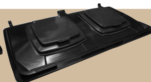
Ergolock Till fyrhjulskärl. Art.nr 0660 803