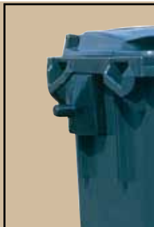
Lyftappar Till 1000-literskärl. Art.nr 844 656