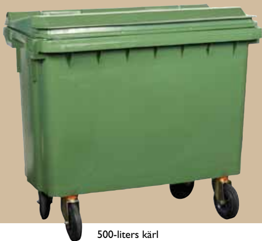
500-liters kärl Art.nr 0500 350 Lock art.nr 0500 380

Lock och kärl kan märkas med varmprägling och/eller insatser i formen. Samtliga PWS kärl är förberedda för montering av transponders.