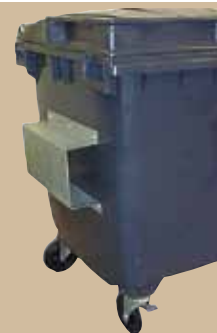
Frontlastartunnlar För hämtning med truck. Art.nr 844 659