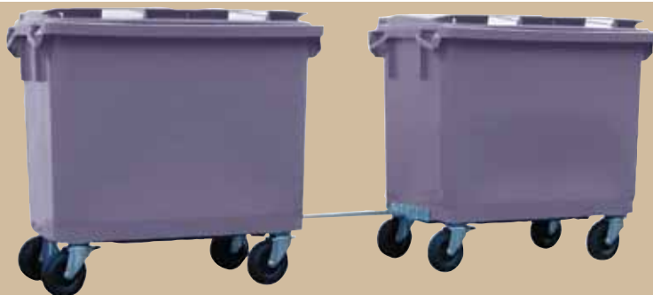
Tågekopplingsset Skrivas fast vid kärlets befintliga hjul. 660 liter. Art.nr 844 658, 1000 liter. Art.nr 844 652